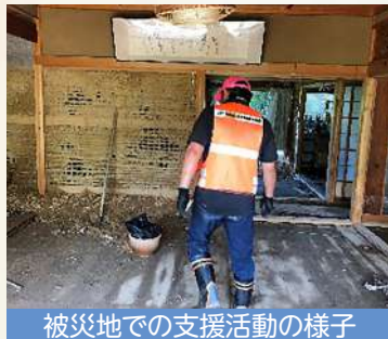
被災地での支援活動の様子