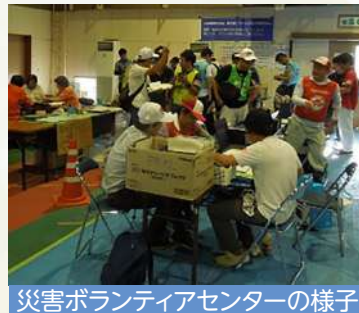
災害ボランティアセンターの様子