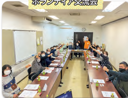
ボランティア交流会