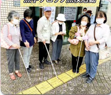
点字ブロック点検活動