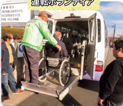
運転ボランティア