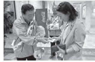
民生委員・児童委員